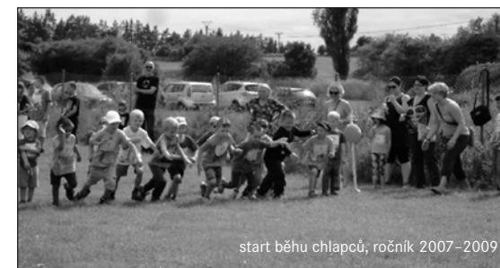
start běhu chlapců, ročník 2007–2009

Skautský dívčí oddíl Kořata je vlastně nejstarším pořadatelem, ač s věkově nejmladšími členy. Mladé skautky a světlušky svědomitě zajišťovaly svá stanoviště, ale měly možnost si také samy zasoutěžit. MOP Malí tuláci měli svá stanoviště v indiánském duchu v okolí týpí za plotem hřiště. Ve výtvarné dílně děti vytvořily 72 půvabných obrázků na téma „Na procházce s mámou a tátou“. Zastoupena tu byla letos poprvé také soukromá Základní škola Trnka z Dobříše . Velké oblibě se už tradičně těší běžecké závody, kterých se zúčastnilo 65 zdatných závodníků.