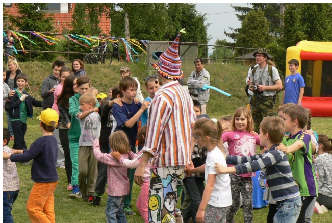
Pořadatelé této akce