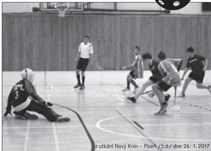
z utkání Nový Knín – Plzeň /5:6/ dne 26. 1. 2017